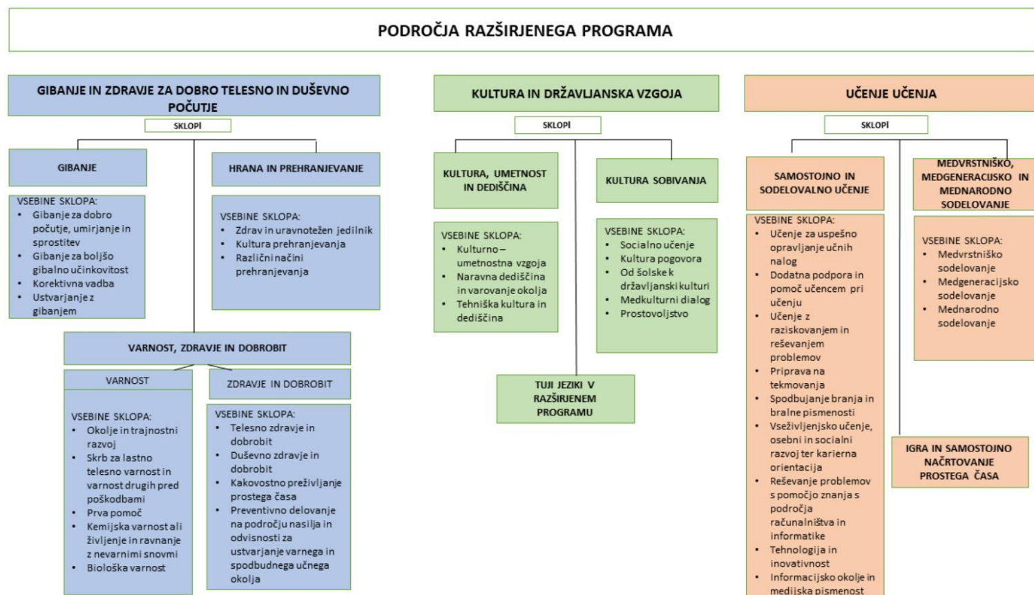
Slika 1: Področja, sklopi in vsebine razširjenega programa

Na Sliki 1 je predstavljena zasnova modela razširjenega programa, ki se deli na tri področja. Področja so razdeljena na vsebinske sklope, le-te pa opredeljujejo priporočene vsebine. Podroben opis sledi v nadaljevanju.