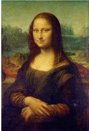
Leonardo da Vinci, Mona Lisa, okoli 1505