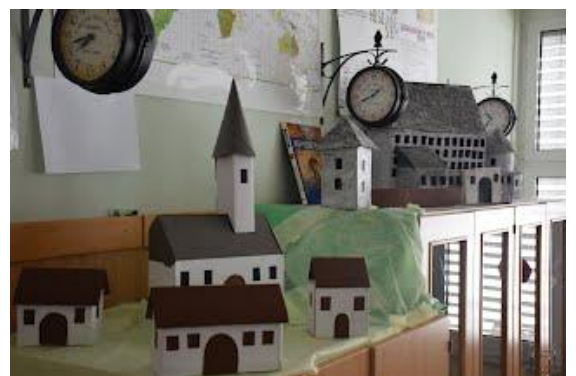
Učenci pri urah OPK izdelali maketo srednjeveškega Majšperka.